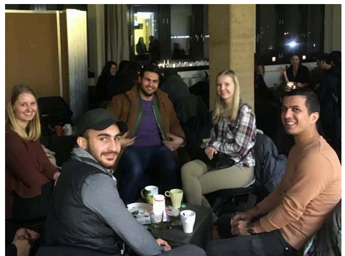
Lockeres Zusammenkommen bei Kaffee oder Tee – Das Café International bietet Raum für Austausch und Kennenlernen

Das Angebot wird sehr gut angenommen. Es sind viele Leute dabei, die wirklich regelmäßig seit zwei Jahren vorbei kommen und die wir schon gut kennen. Es kommen überwiegend junge Leute mit Migrationshintergrund, aber auch deutsche Studierende der HSB ins Café. In Absprache mit dem International Office möchten wir das Café International in Zukunft etwas mehr öffnen und über die ursprüngliche Hauptzielgruppe von Geflüchteten hinaus auch Studierende mehr einbeziehen. Wir möchten z.B. internationale Hauptörer an der HSB besser erreichen.